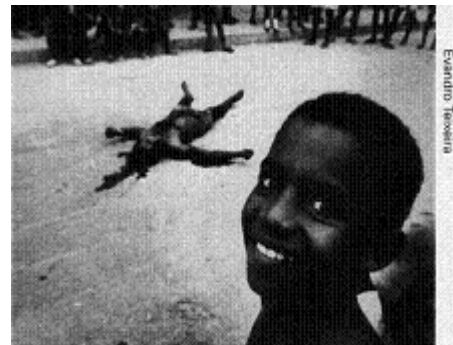
FIGURA IV – A face FONTE – OLIVEIRA, 2005, p. 22.

Na foto das iranianas, os véus preto e branco dão a configuração fundo-forma à cena, instituindo dimensão aos corpos, numa primeira tomada emergidos como uma massa uniforme, e profundidade espacial ao todo. Na imagem dos judeus em oração, é a fumaça que compõe o cenário brumoso sob o qual as figuras têm seus contornos diluídos em efeitos de uma técnica impressionista. Na figura do menino de olhar melancólico, sem véu e sem bruma, trata-se da própria lógica pictórica da imagem, portanto de um agenciamento dos formantes plásticos da expressão, que determinam o filtro de leitura propiciando à fotografia a sensação de uma tela. O próprio texto verbal fortalece esse viés