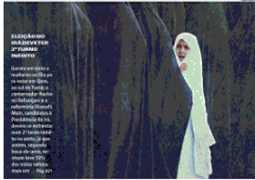
FIGURA I – O véu