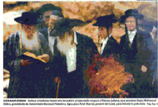
FIGURA II – A bruma